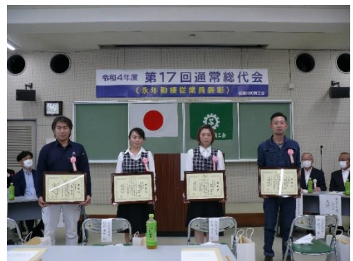
永年勤続従業員表彰

今もなお、新型コロナウイルス感染症の影響があり、自治体や企業などには難しい運営が求められております。商工会と致しましても、関係機関と連携し小規模事業者への経営支援や地域振興事業に積極的に取り組み、会員サービスに努めてまいります。